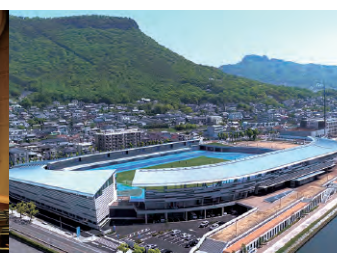
屋島レクザムフィールド(高松市屋島競技場)