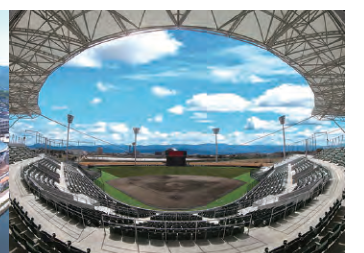
レクザムホールパーク丸亀(丸亀市民球場)